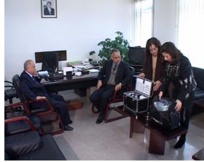
قدمت منظمة الصحة العالمية إلى وزارة المياه والطاقة مختبراً متنقلاً للمياه