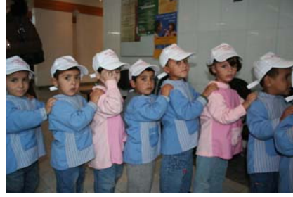
أطفال من دار الأيتام الإسلامية ينتظرون أن يتم تلقحهم يوم إطلاق حملة اللقاح الوطنية ضد شلل الأطفال.